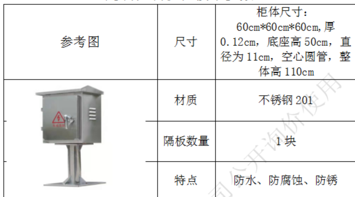
定制控制机柜技术参数